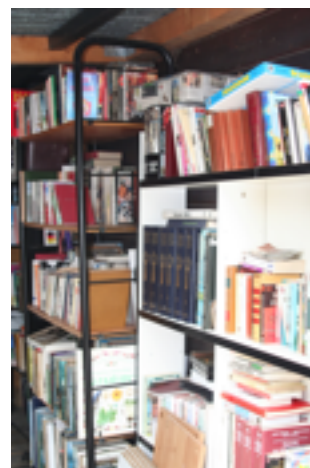
« Le coin du lecteur »

Vous trouverez le « coin du lecteur » où M. Borloz met à votre disposition les livres dont les usagers du site se séparent. Il existe même une vidéothèque, composée essentiellement de cassettes au format VHS.