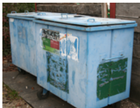
Conteneur pour entreposer les boîtes de conserve APLATIES .

Rappelons que les autres matériaux ferreux sont à déposer dans les bennes ad hoc situées au fond de la déchetterie, près de la sortie [voir pt. 14]