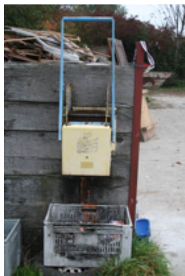
Presse pour boîtes de conserve

sont à bien aplatir à l'aide de la presse mise à disposition. Même remarque que pour les barquettes en aluminium, MERCI DE LES RINCER . Juste les rincer ! Certains restes finissent par dégager des odeurs repoussantes. Merci d'avance pour les autres usagers.