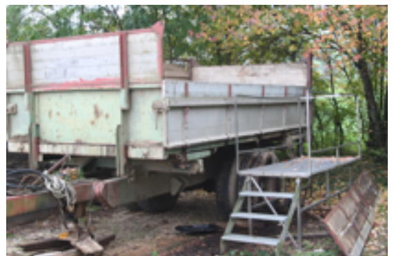
Remorque pour le gazon

Le gazon est déposé dans la remorque, parce qu'il produit beaucoup de liquide.